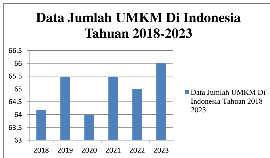
Grafik 1. 1 Data Jumlah UMKM di Indonesia Tahun 2018-2023

Berdasarkan data dari KADIN Indonesia yang dapat dilihat pada Grafik 1.1, dimana melalui gambar tersebut dapat dilihat bahwa terdapat grafik yang naik turun terhadap jumlah UMKM yang ada di Indonesia. Pada tahun 2020, terjadi penurunan jumlah UMKM sebesar 2,24% dan pada tahun 2022 mengalami penurunan sebesar 0,70%. Dari informasi tersebut dapat kita simpulkan bahwa masih terdapat UMKM yang tidak berhasil dalam mengembangkan dan mempertahankan usaha mereka.