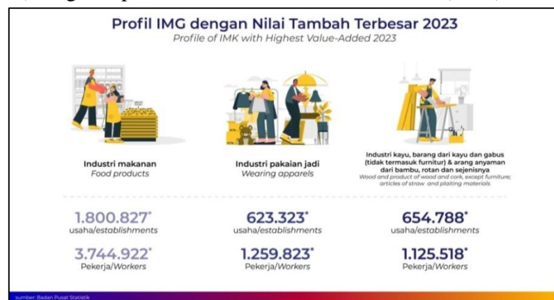
Gambar 1. 1 Jumlah UMKM Pada Industri Makanan

Pada Gambar 1.1 yang dilansir dari kadin.id, berdasarkan data dari Badan Pusat Statistika (BPS) pada tahun 2023 terdapat 1.800.827 usaha yang bergerak di sektor makanan dan minuman. Dimana hal ini menunjukkan bahwa mayoritas Usaha Mikro Kecil dan Menengah (UMKM) bergerak pada sektor makanan dan minuman (F&B).