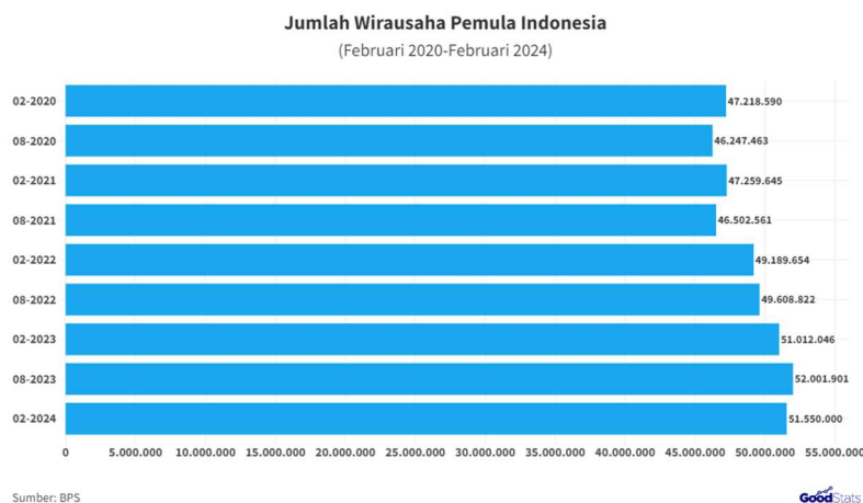
Gambar 1.1 Jumlah Wirausaha Pemula Indonesia

Mahasiswa yang memiliki niat berwirausaha semakin berkurang maka pada masa yang akan datang akan semakin sedikit lapangan pekerjaan yang terbuka sehingga tingkat pengangguran akan semakin meningkat. Untuk menekan tingkat pengangguran maka yang harus dilakukan adalah berwirausaha. Niat berwirausaha dapat membantu untuk menciptakan lapangan pekerjaan yang baru sehingga tingkat pengangguran akan semakin rendah.