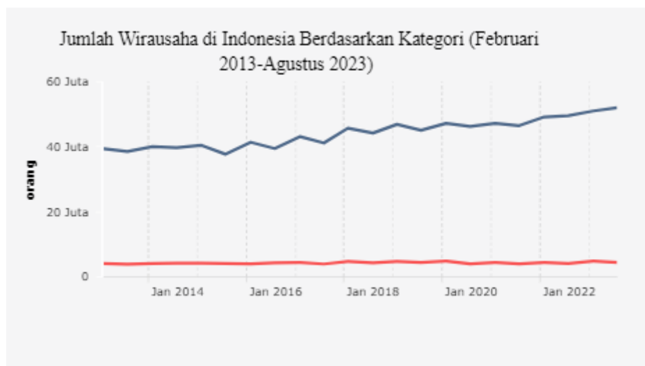
Gambar 1. 1 Jumlah Wirausaha di Indonesia berdasarkan kategori (2013-2023)

Bermula dari tahun 1998 Dimana perekonomian Indonesia dalam sektor perusahaan besar menurun dan melemah dalam kondisi perekonomian di Indonesia. Berbeda dengan zaman sekarang yang dimana jumlah Kewirausahaan dan perekonomian di Indonesia terus meningkat setiap tahunnya di beberapa kategori yang berbeda. Dengan minat dari setiap generasi muda yang dimana memiliki keterkaitan dan niat terhadap kewirausahaan hal tersebut membuat pertumbuhan wirausahaan di Indonesia itu berkembang setiap tahunnya.