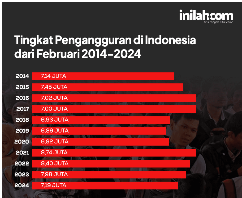
Gambar 1.1 Tingkat Pengangguran di Indonesia

Indonesia merupakan negara berkembang dengan jumlah penduduk besar dan sumber daya alam yang kaya. Namun karena banyaknya jumlah pekerja di Indonesia, masih terdapat pengangguran dan jumlahnya tidak sebanding dengan jumlah lapangan pekerjaan yang tersedia. (Risma, Syamsul, Fathur, 2024)