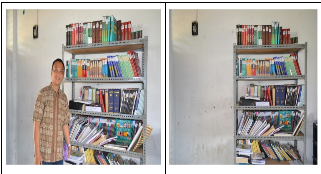
Gambar 3. Hasil Pembuatan Rak Buku Baru

Untuk semakin meningkatkan mutu dan kualitas perpustakaan, maka kegiatan Pengabdian Kepada Masyarakat ini juga meliputi pembuatan rak buku baru untuk tempat penyimpanan buku-buku koleksi perpustakaan. Berdasarkan hasil pengumpulan data awal diperoleh data bahwa rak buku di perpustakaan Madrasah Tsanawiyah dan Aliyah Al Inayah sudah dalam kondisi memprihatinkan. Pertama jumlahnya tidak sesuai dengan jumlah buku yang dimiliki, sehingga banyak koleksi buku yang ditumpuk di dalam kardus dan diletakkan di lantai ruang perpustakaan. Kedua rak bukunya sudah tidak dapat berdiri tegak, sehingga posisinya agak miring dan sangat membahayakan karena dapat dengan tiba-tiba rubuh. Perbaikan sendiri dilakukan dengan membuat beberapa rak buku baru dengan bantuan tukang. Dengan adanya rak buku baru ini koleksi buku yang sebelumnya diletakkan dalam kardus dapat ditata rapi pada tempatnya sehingga dapat dibaca dan dinikmati oleh seluruh siswa.