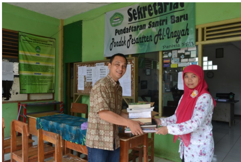
Gambar 4. Foto Tim FIKom UNTAR Bersama Perwakilan Sekolah

Berdasarkan hasil wawancara juga diketahui bahwa koleksi buku yang dibutuhkan pihak sekolah adalah buku jenis fiksi, seperti novel, majalah, dll. Pengurus perpustakaan Madrasah Tsanawiyah dan Aliyah Al Inayah memiliki keinginan untuk meningkatkan minat baca para siswa disana dengan memperbanyak koleksi buku fiksi tetapi karena kekurangan dana hal tersebut belum dapat dilaksanakan. Oleh karena itu, tim pengabdian FIKom UNTAR juga memberikan bantuan berupa buku-buku berjenis fiksi sesuai dengan permintaan pihak Madrasah Tsanawiyah dan Aliyah Al Inayah.