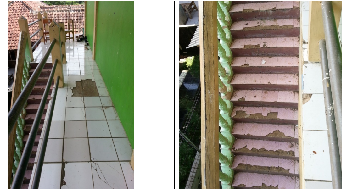
Gambar 1. Kondisi Madrasah Tsanawiyah dan Aliyah Al Inayah

Berdasarkan gambar tersebut dapat dilihat bahwa kondisi perpustakaan di Madrasah Tsanawiyah dan Aliyah Al Inayah sangat memprihatinkan dan jauh dari kata layak, sehingga tepat bila tim pengabdian mengadakan Kegiatan Pengabdian Kepada Masyarakat disana. Berangkat dari identifikasi awal permasalahan dengan khalayak sasaran, maka dapat dirumuskan permasalahan sebagai berikut: (1) Kondisi perpustakaan yang sangat memprihatinkan; (2) Kurangnya koleksi buku untuk menarik minat baca siswa; (3) Kurangnya minat baca siswa untuk membaca buku; (4) Kurangnya tenaga SDM untuk membantu mengelola perpustakaan.