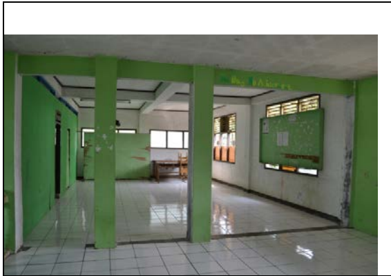
Gambar 2. Hasil Perbaikan Lantai

Untuk semakin meningkatkan mutu dan kualitas perpustakaan, maka kegiatan Pengabdian Kepada Masyarakat ini juga meliputi pembuatan rak buku baru untuk tempat penyimpanan buku-buku koleksi perpustakaan. Berdasarkan hasil pengumpulan data awal diperoleh data bahwa rak buku di perpustakaan Madrasah Tsanawiyah dan Aliyah Al Inayah sudah dalam kondisi memprihatinkan. Pertama jumlahnya tidak sesuai dengan jumlah buku yang dimiliki, sehingga banyak koleksi buku yang ditumpuk di dalam kardus dan diletakkan di lantai ruang perpustakaan. Kedua rak bukunya sudah tidak dapat berdiri tegak, sehingga posisinya agak miring dan sangat membahayakan karena dapat dengan tiba-tiba rubuh. Perbaikan sendiri dilakukan dengan membuat beberapa rak buku baru dengan bantuan tukang. Dengan adanya rak buku baru ini koleksi buku yang sebelumnya diletakkan dalam kardus dapat ditata rapi pada tempatnya sehingga dapat dibaca dan dinikmati oleh seluruh siswa.