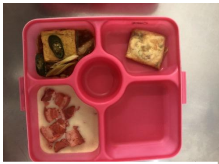
Gambar 3: Menu makan sore hari pertama