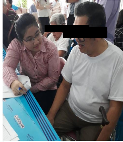
Gambar 8: Wawancara