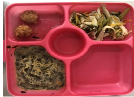
Gambar 2: Menu makan siang hari pertama