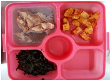
Gambar 5: Menu makan siang hari kedua