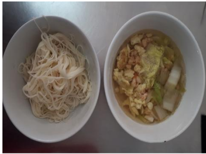
Gambar 1: Menu makan pagi hari pertama