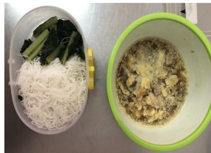
Gambar 4: Menu makan pagi hari kedua