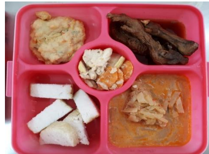
Gambar 6: Menu makan sore hari kedua