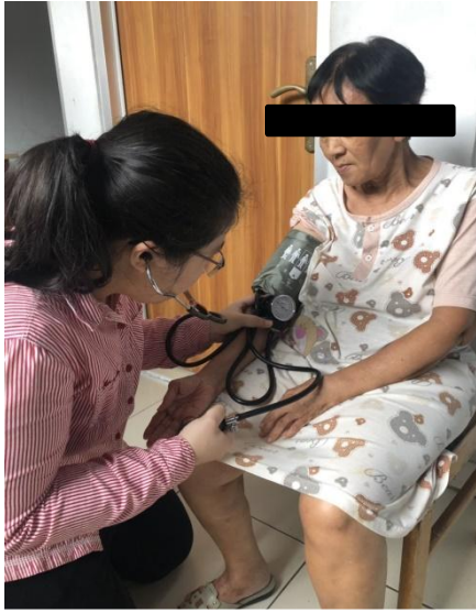
Gambar 7: Pengukuran tekanan darah