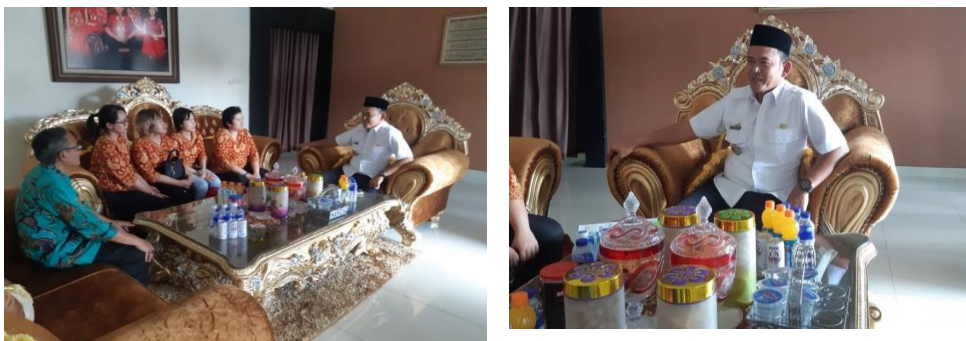
Gambar 3: Suasana Sambutan Bapak Wakil Bupati Kabupaten Pringsewu