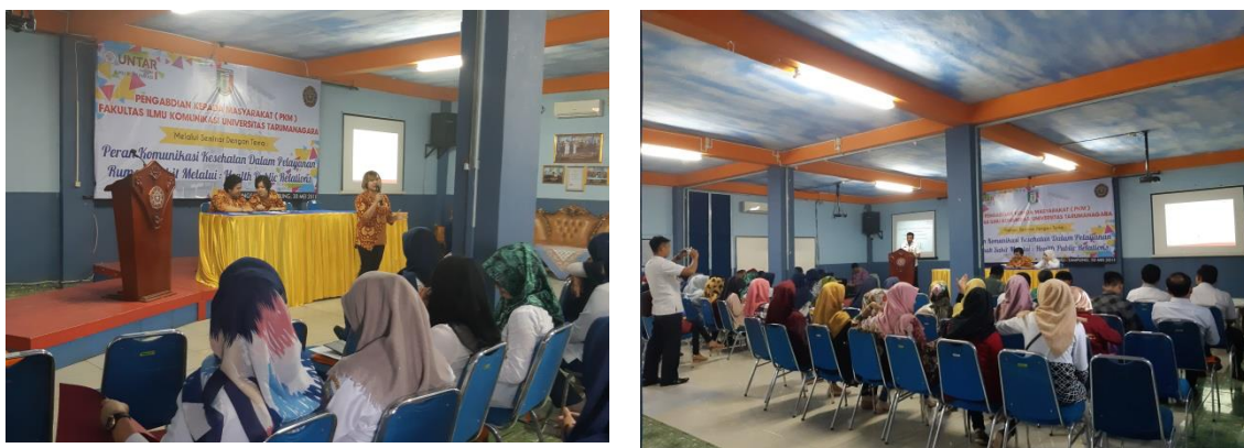
Gambar 2: Suasana Penyuluhan

Manajemen komunikasi kesehatan merupakan organisasi atau institusi yang penting yang bergerak di bidang pelayanan kesehatan, seperti rumah sakit, puskesmas, dan klinik kesehatan lainnya, bagian yang menjalankan manajemen komunikasi ini sebetulnya menjalankan fungsi Public Relations. Lebih lanjut Public Relations di rumah sakit klinik pada dasarnya menjalankan fungsi PR di industri yang bergerak dibidang kesehatan ini tidak terlalu berbeda dengan fungsi PR di bidang lainnya. Tujuan utamanya adalah memelihara hubungan jangka panjang dan mengelola reputasi dari rumah sakit tersebut. Berikut ini adalah dokumentasi pembicara dalam kegiatan penyuluhan “ Peran Komunikasi Kesehatan Dalam Pelayanan Rumah Sakit Melalui Health Public Relations ”.